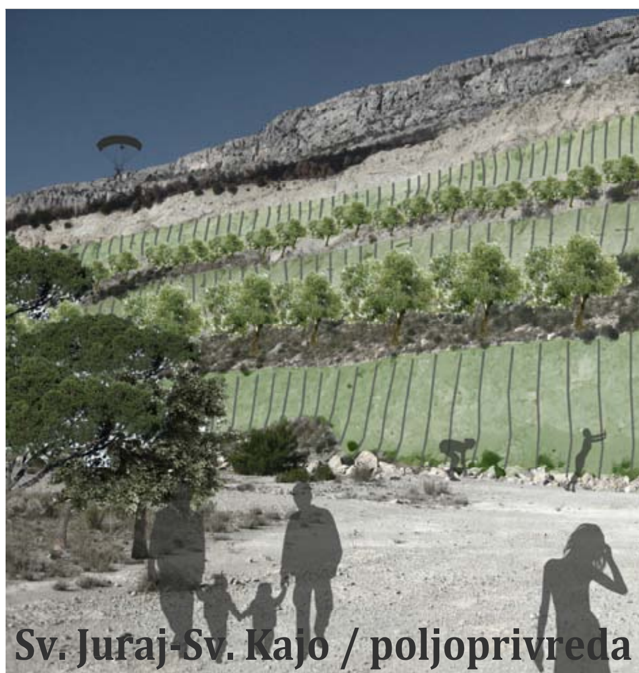
Sv. Juraj-Sv. Kajo / poljoprivreda

U sklopu sve aktualnije teme prenamjene i revitalizacije postrudarskih krajolika, rad propituje mogućnosti takvog djelovanja na splitskom području, i to kroz sociološku studiju o aspektima prenamjene prostora kamenoloma te kroz urbanistička rješenja tri odabrana kamenoloma (Sv. Juraj-Sv. Kajo, Slatine, Okrug Donji) koji, s obzirom na karakter, veličinu, tip i trajanje eksploatacije i položaj u prostoru predstavljaju presjek trenutnog stanja u eksploataciji kamena na širem splitskom području.