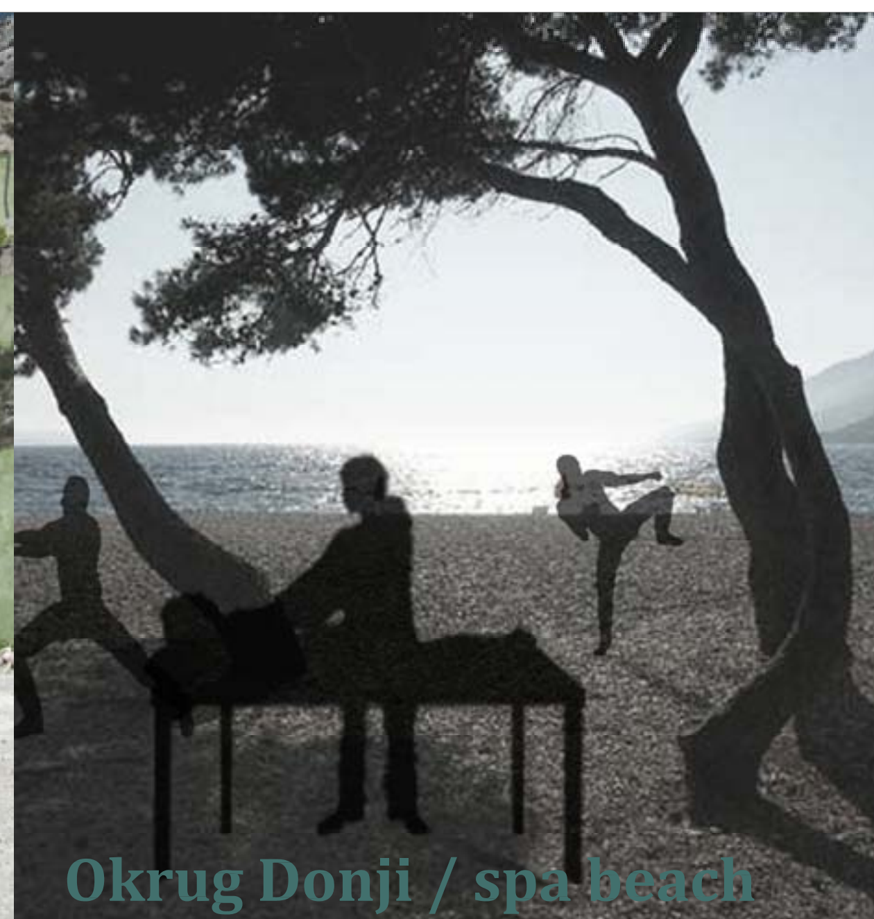
Okrug Donji / spa beach