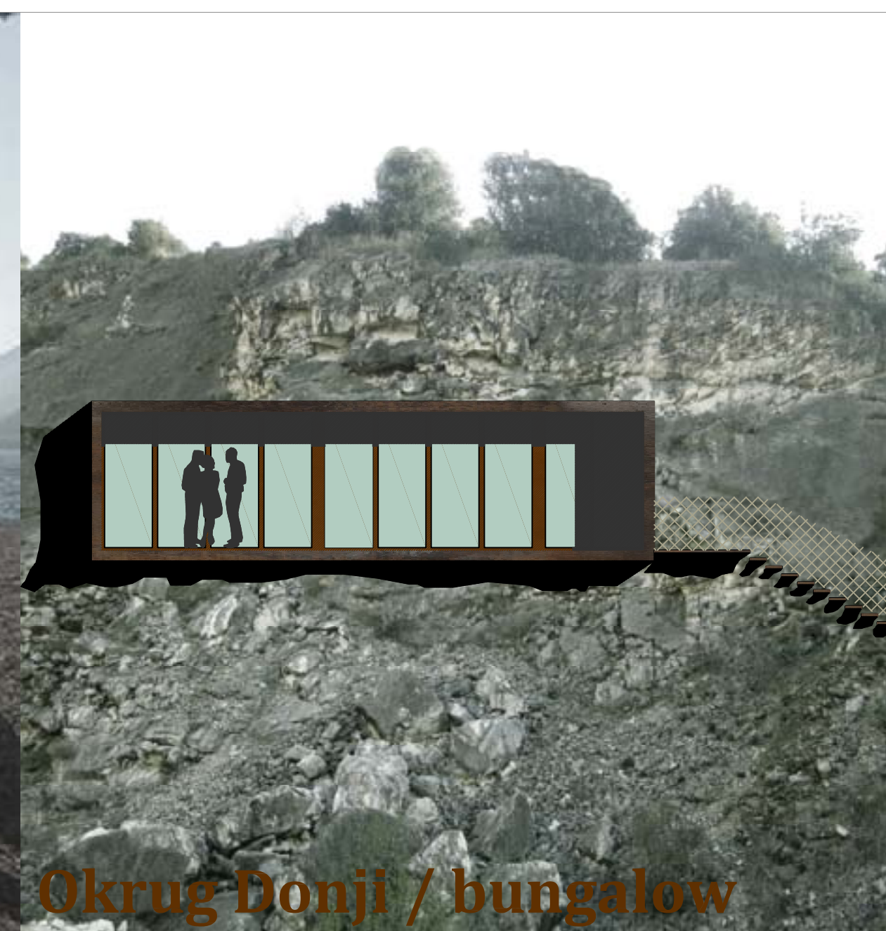
Okrug Donji / bungalow