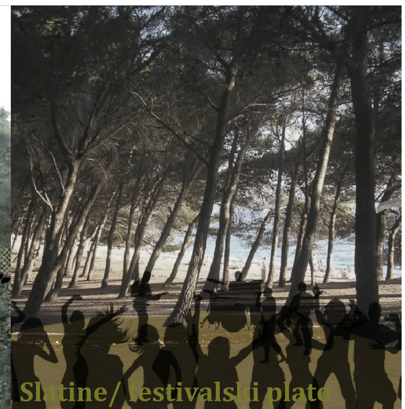
Slatine / festivalski plato